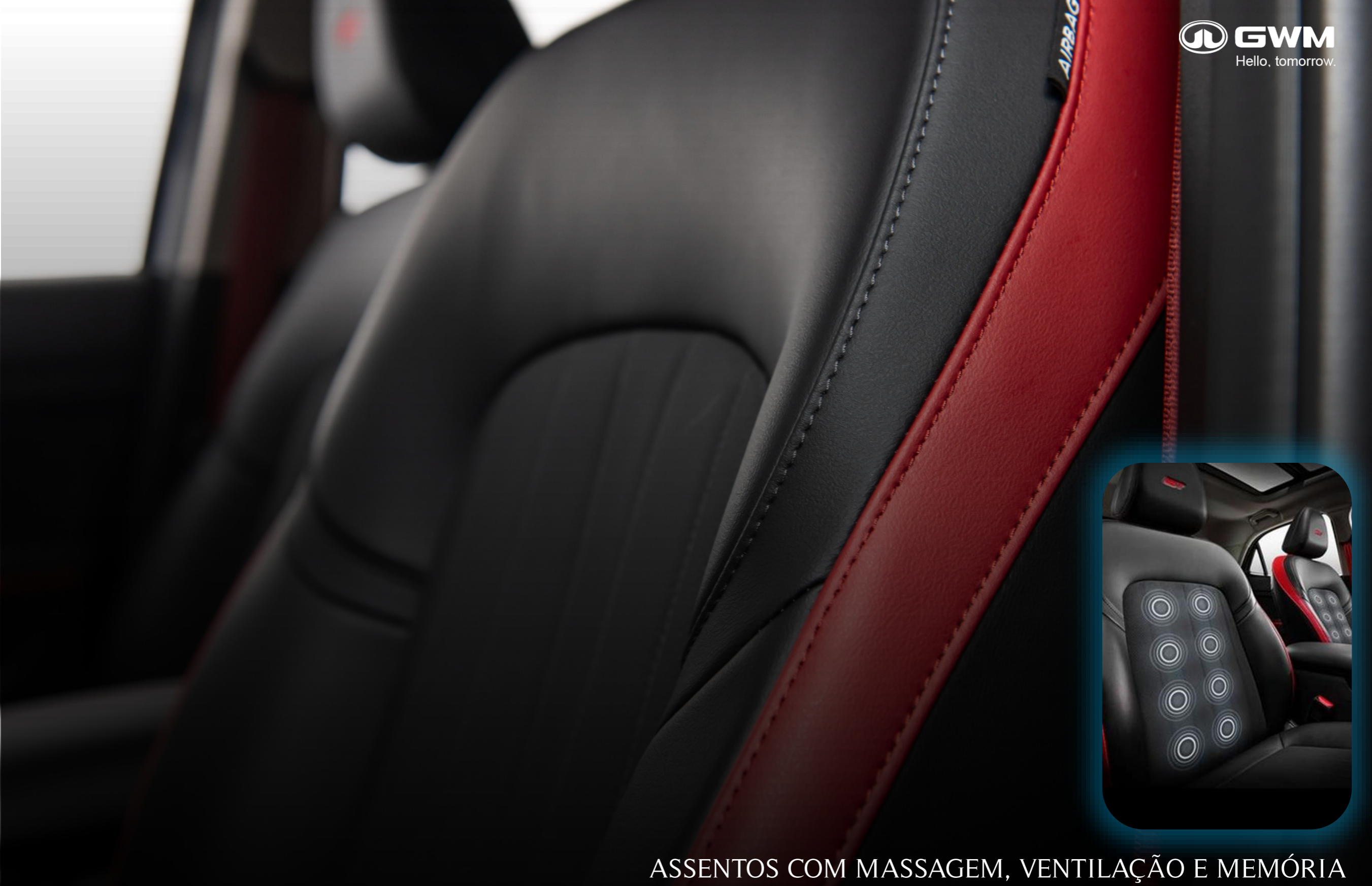
ASSENTOS COM MASSAGEM, VENTILAÇÃO E MEMÓRIA